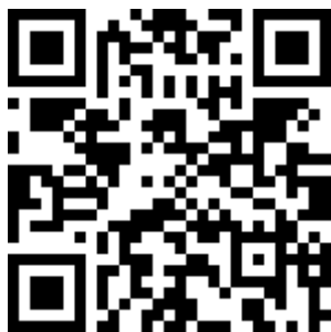
Видеоальбом «Азбука побед: на земле, на море и в небе»