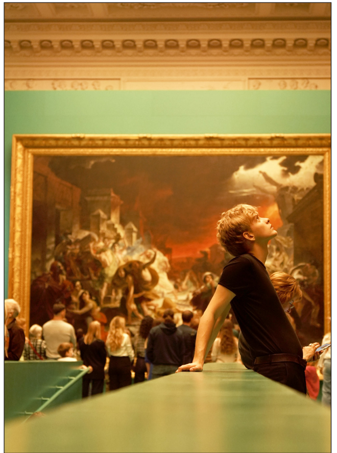
Фоторепортаж «На выставке картин», Киселёв Владислав, МОБУ «СОШ «Агалатовский ЦО», Студия кино и ТВ «ШКВАЛ»