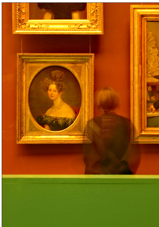
Фоторепортаж «На выставке картин» Киселёв Владислав, МОБУ «СОШ «Агалатовский ЦО», Студия кино и ТВ «ШКВАЛ»