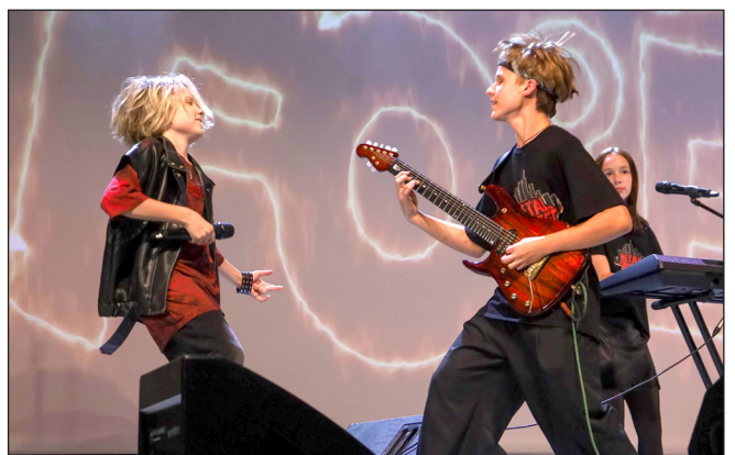
Фоторепортаж «Концерт от Metal forest», Завьялов Иван, МОБУ «Гимназия» г. Сертолово, Медиацентр «Три кита»