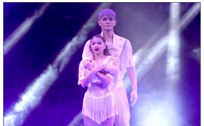
Фоторепортаж «Цирк! Цирк! Цирк!», Гурак-Ширинская Вера, МОБУ «Гимназия» г. Сертолово, Медиацентр «Три кита»