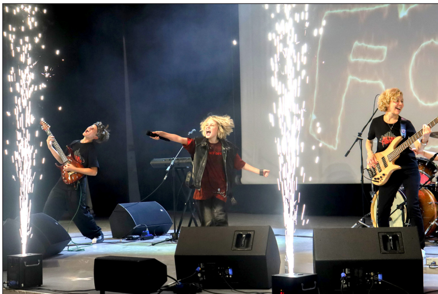
Фоторепортаж «Концерт от Metal forest», Завьялов Иван, МОБУ «Гимназия» г. Сертолово, Медиацентр «Три кита»

Это и есть моё богатство – не в кошельке, а в крови. Они – мои буквы в фамилии.