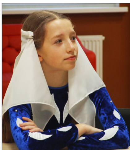
Фоторепортаж «Под небом одним», Аникина Елизавета, МОБУ «Муринская СОШ № 6», Медиациентр «Ветер Перемен»