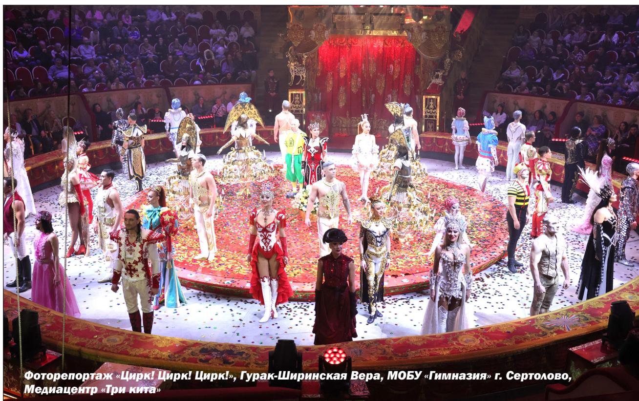
Фоторепортаж «Цирк! Цирк! Цирк!», Гурак-Ширинская Вера, МОБУ «Гимназия» г. Сертолово, Медиациентр «Три Кита»

Праздник в Осельковской школе получился не просто официальным, а живым и тёплым. И, кажется, он доказал: единство народов России – это не скучная строка из учебника, а то, что окружает нас каждый день.