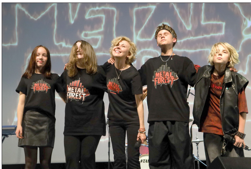
Фоторепортаж «Концерт от Metal forest», Завьялов Иван, МОБУ «Гимназия» г. Сертолово, Медиацентр «Три кита»

Семья, это не только о профессии или работе. Семья – это