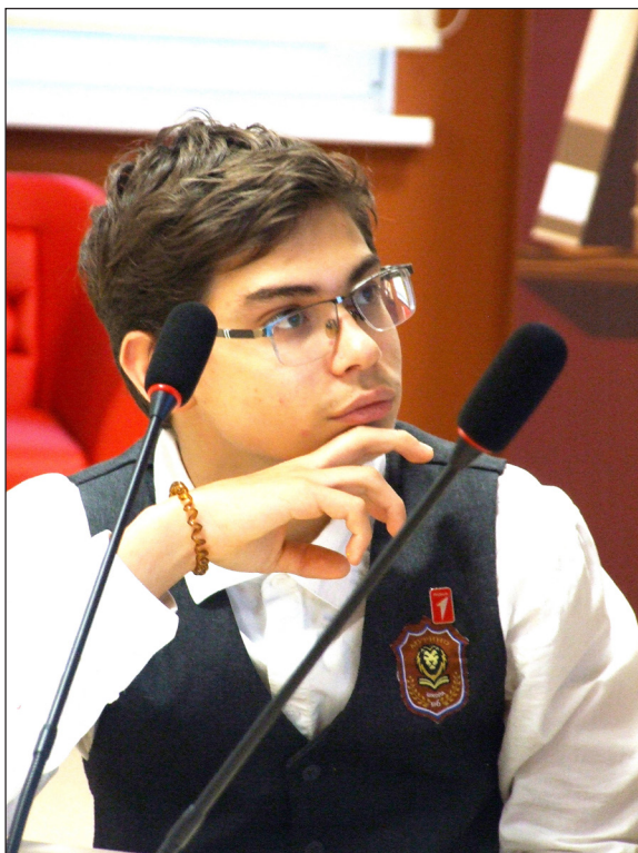
Фоторепортаж «Под небом одним», Аникина Елизавета, МОБУ «Муринская СОШ № 6», Медиацентр «Ветер Перемен»

время появилось много документальных фильмов о Специальной военной операции. Их необходимо обязательно показывать подрастающему поколению, воспитывать патриотизм и готовность защищать своё Отечество, показывать не только по телевидению, но и в кинотеатрах.