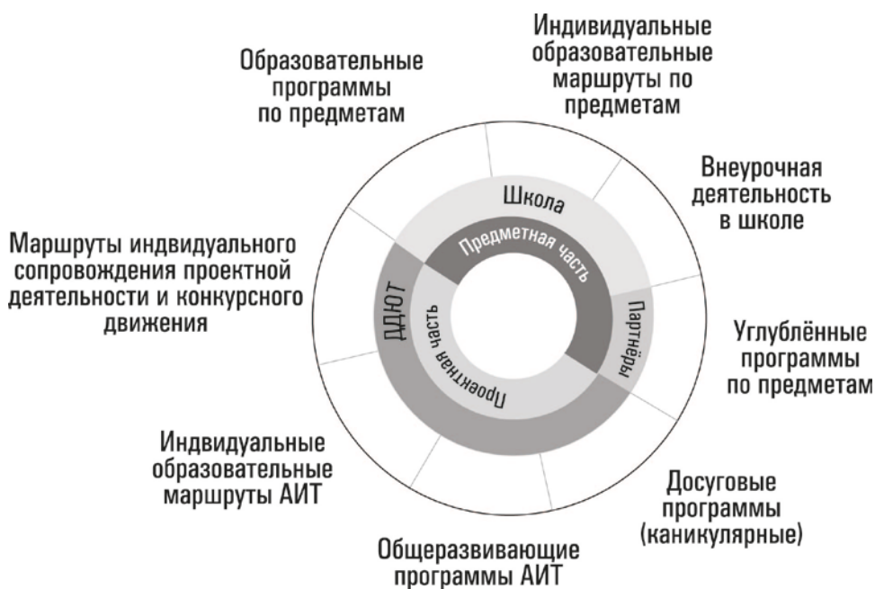
Рис. 3. Интеграционная модель сопровождения интеллектуальной и творческой одарённости в проекте «АИТ»

Дополнительное образование интегрировано с основным образованием по предметным областям, а также, углублённым образованием по предметным областям, предлагаемым партнерами. Включение в образовательный процесс ресурсов различных образовательных организаций и сетевых партнёров позволяет на новом качественном уровне формировать ключевые компетенции одарённых обучающихся, повышать эффективность реализации индивидуальных образовательных маршрутов и траекторий как по предметным областям, так и в проектной творческой и исследовательской деятельности, в результате чего в полной мере реализуется интеллектуальный и творческий потенциал одарённых обучающихся.