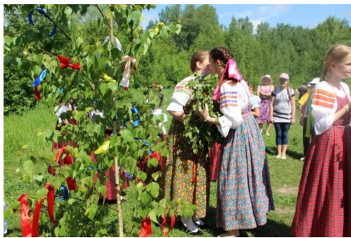
Слайд № 7