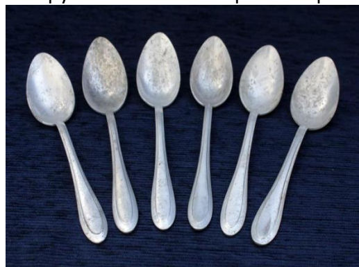
Слайд № 5 Алюминиевые ложки

Педагог: Сегодня мы с вами повторяем наши фигуры на учебных ложках (железных) под инструментальный наигрыш «Барыня».