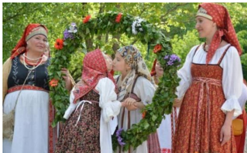
Слайд № 5