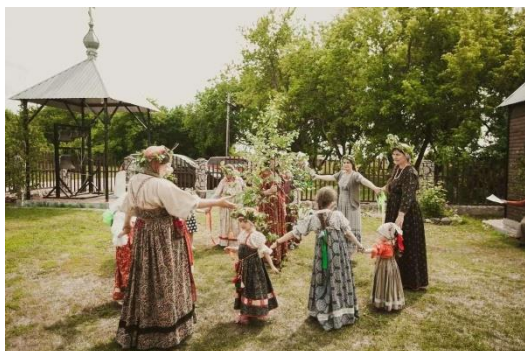
Слайд № 8

После кумления девушки шествовали по деревне, водили хороводы, пели песни, устраивали «в складчину» обрядовую трапезу, что закрепляло их новое сообщество. Главными блюдами были яйца, яичница, а также изделия из теста. С давних пор считалось хорошей приметой свататься на Троицу. Свадьбу играли осенью, на праздник Покров Пресвятой Богородицы.