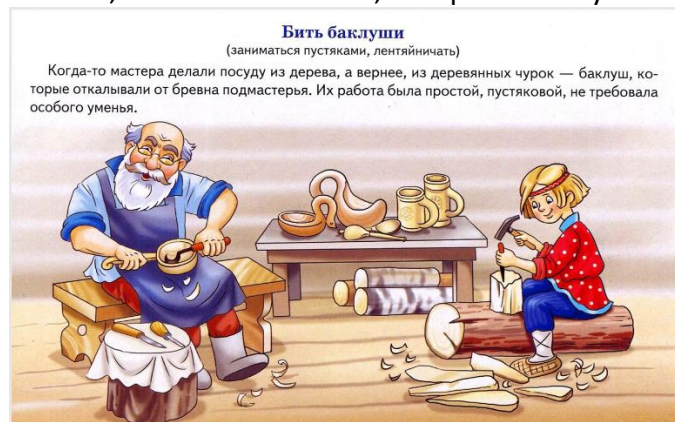
Слайд №3 Бить баклуши

Участник ансамбля 1: Считалось, что бить баклуши – это самая простая работа при изготовлении ложек, выполнял её часто самый ленивый подмастерье или ученик. Поэтому и сейчас, когда хотят сказать, что кто-то ленится, говорят: «Баклуши бьет!».