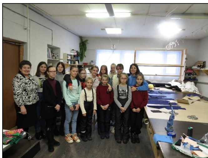
2021 г. Экскурсия на швейное производство.