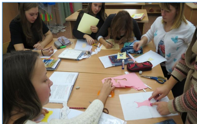
2019 г. Семейная мастерская.