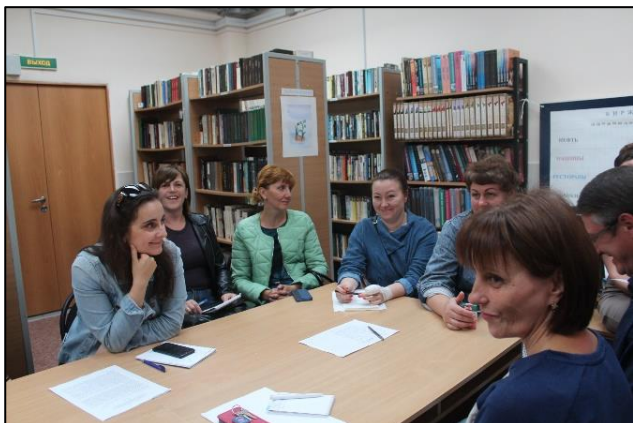
2019 г. Вечер вопросов и ответов.