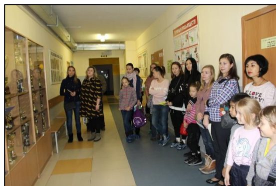
2019г. День открытых дверей.