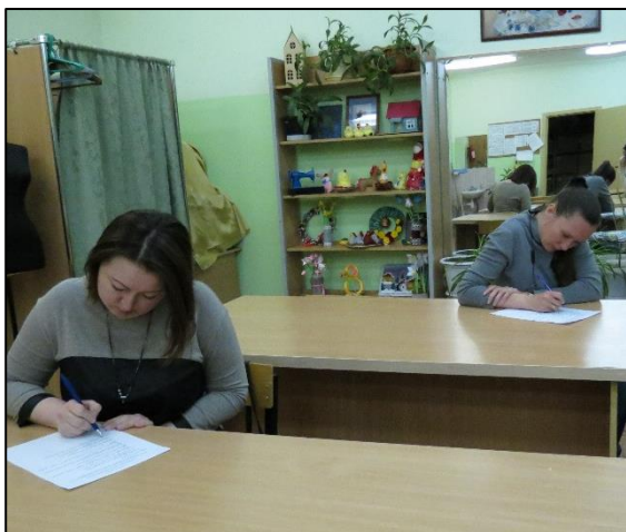
2021г. Индивидуальные беседы.