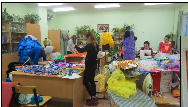
2019 г. Семейная мастерская.