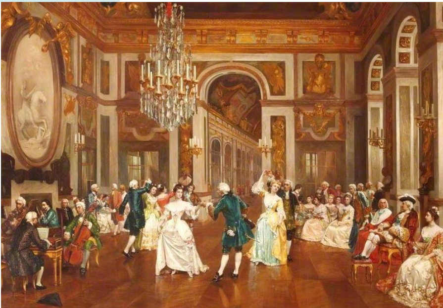
Бальные танцы XVIII века

Эти два направления культуры – европейское и негритянское – в Новом Свете (Америке) оказывали влияние друг на друга и в конце концов ассимилировались (ассимилироваться – уподобиться). Таким образом, можно сделать вывод, что процесс зарождения джазового