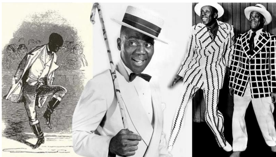
Уильям Хенри Лейн

В конце XVIII века в крупных городах либерального Севера возникли музыкальные шоу для белой публики, в которых белые исполнители, надев маски негров и их костюмы, имитировали африканские песни и танцы. Конечно, они не были идентичны оригиналу, однако экзотичность и гротесковость подобных зрелищ была хорошей приманкой для публики. В 1830 году в театре города Луисвиль Томас Дарт-мунд Раис поставил спектакль, в котором принял участие знаменитый черный танцор того времени Уильям Хенри Лейн - "Мастер Джуба". Это был первый чернокожий исполнитель, чье имя сохранила история джазового танца.