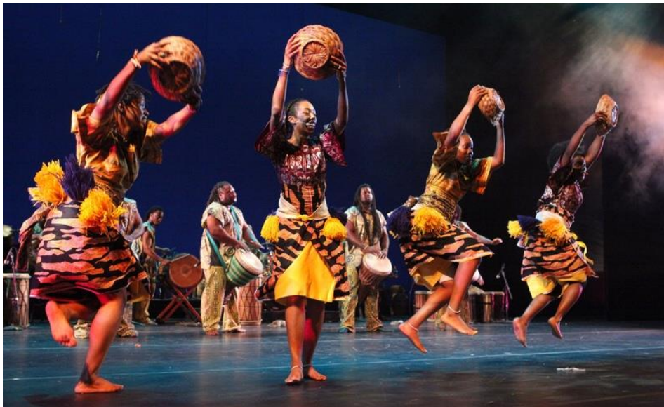
Танец – Конго

1917-1930 годы – вершина развития джазового танца. "Черный" танец и музыка становились неотъемлемой частью музыкальных спектаклей на Бродвее и в Гарлеме (улица и район в Нью-Йорке). Выдающиеся исполнители того времени – Билл Робинсон, Берт Вильям – были в центре всех музыкальных представлений в "черном" варьете Гарлема, столицы негритянского искусства и культуры, история которого началась с 1920 года.