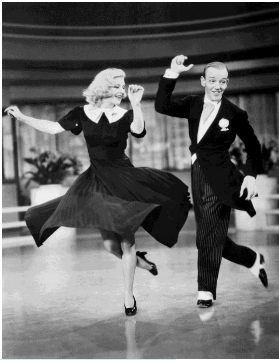
Танец - Чарльстон