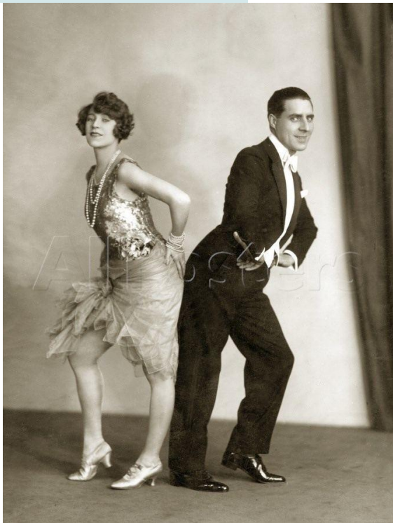
Танец - Блэк Боттон