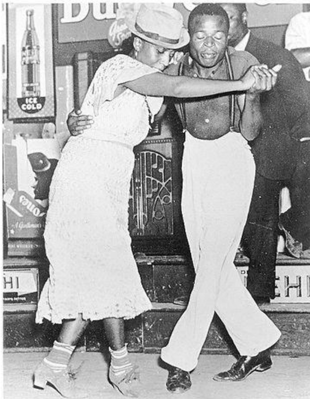
Танец - Биг Аппл