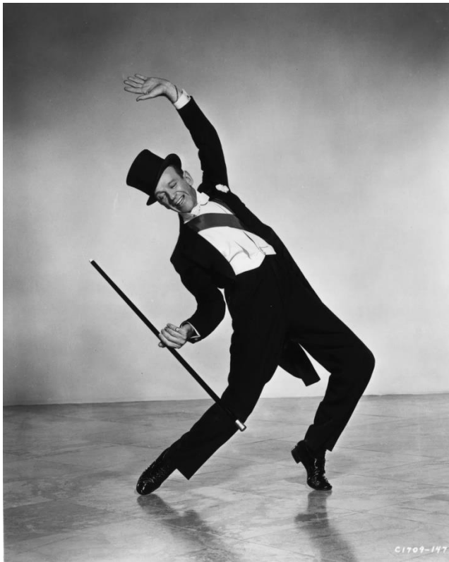
Танец - Ту стэн