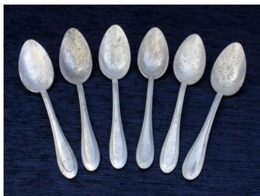
Слайд № 5 Алюминиевые ложки

Педагог: Сегодня мы с вами повторяем наши фигуры на учебных ложках (железных) под инструментальный наигрыш «Барыня».