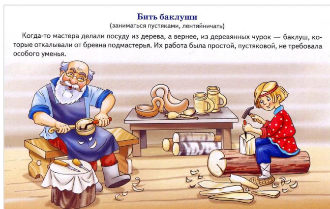
Слайд №3 Бить баклуши

Участник ансамбля 1: Считалось, что бить баклуши – это самая простая работа при изготовлении ложек, выполнял её часто самый ленивый подмастерье или ученик. Поэтому и сейчас, когда хотят сказать, что кто-то ленится, говорят: «Баклуши бьет!».